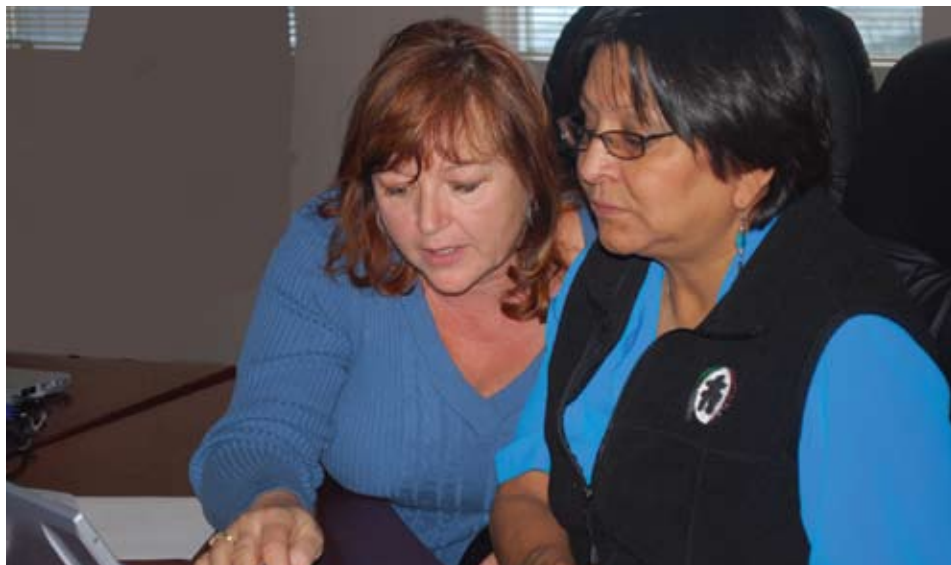
Des membres de plus de 200 communautés et organismes autochtones suivent ce cours de lutte contre le cancer.

Le cours n'aborde pas seulement les traitements; il offre également de l'information sur la prévention,