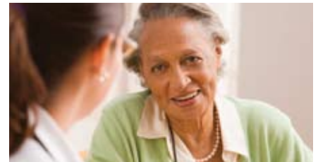
Les plans de traitement aident les patients à communiquer avec leurs prestataires de soins de santé après leur traitement contre le cancer

Les projets pilotes des plans de traitement ont été choisis lors d'un appel d'offres concurrentiel dirigé par le groupe de travail national sur la survie au cancer du groupe d'action pour l'expérience globale du cancer du Partenariat. Les projets sont les suivants : • Young Adult Cancer Canada met en place des plans de traitement sur le Web. Ces plans sont destinés aux